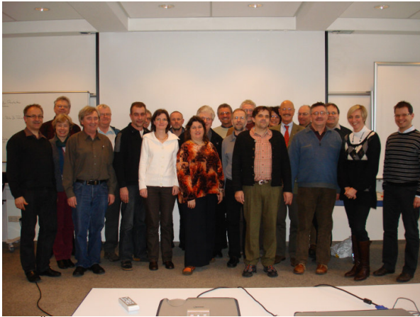
Bild: Ökumenische Konferenz der Gefängnisseelsorgerinnen Rheinland-Pfalz/Saarland mit dem Referenten, Pater Dr. Tobias Specker, SJ (ganz rechts)

Strafvollzugsgesetz im Saarland im Entstehungsprozess, Anhörungen stehen noch aus.