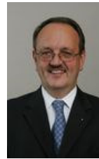
Prof. Herbert Landau

zu gehören Ministerialbeamte, die Konzeptionen zu entwickeln und Aufsicht auszuüben haben, damit dem Willen des Grundgesetzes Rechnung getragen wird. Vor allem aber trifft die Verantwortung das Parlament als Gesetzgeber und auch als Kontrollorgan gegenüber dem parlamentarisch verantwortlichen Minister und dem Strafvollzug als exekutive Behörde.